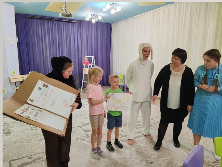
Пример для подражания

Ваша увлеченность чтением заразительна для ребенка.